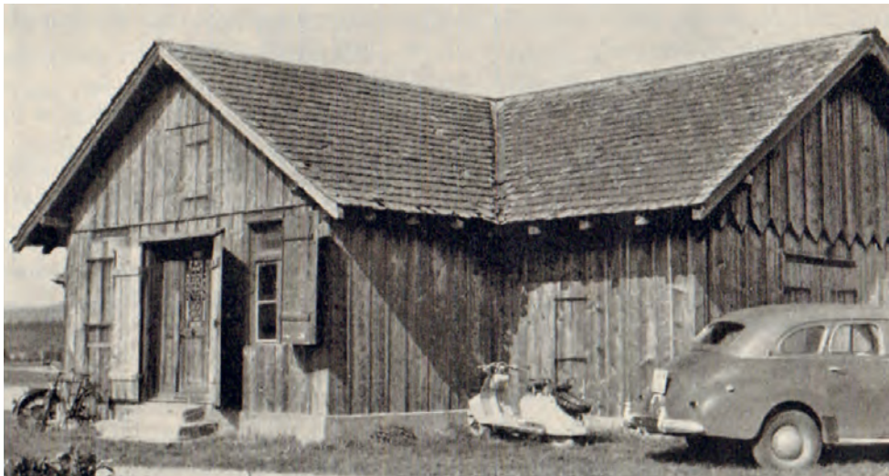
Das 1956 abgebrochene alte Schützenhaus

Ein Höhepunkt der Geschichte ist mit Bestimmtheit das Kantonal-Schützenfest, das