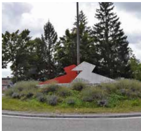
Der Entenkreisel verschwindet

Mit dem Ausbau des kantonalen Hauptstrassennetzes wird der Druck auf untergeordnete Strassen durch Ausweichverkehr reduziert. Dies wird sich besonders auch in einer geringeren Lärmbelastung niederschlagen – sowohl entlang der Haupt- als auch der Nebenachsen.