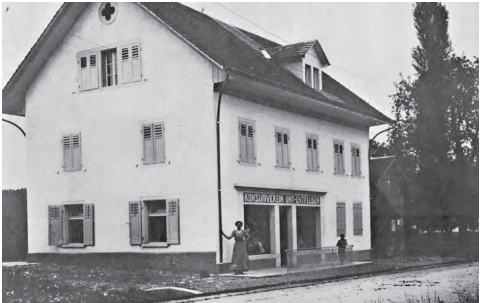
Konsum Unterentfelden, ehemals Schulhaus der Gemeinde von 1819 bis 1911, ca. 1925

(VSK) war, konnte sie ein gegenüber den bisherigen Lebensmittelläden stark erweitertes Warenangebot präsentieren. Im Zuge der regen Bautätigkeit am Distelberghang ergriff die Genossenschaft 1954 die Gelegenheit, an der Ecke Hauptstrasse/Birkenweg eine Filiale zu eröffnen, die aus wirtschaftlichen Gründen 1982 aufgegeben wurde. Im Jahre 1973 trat die Konsumgenossenschaft auf ein Übernahmeangebot von Coop Aargau aus finanziellen Erwägungen nicht ein. Im Gegenteil, man beschloss einen Ladenneubau trotz der Drohung der Coop-Zentrale in einem eigenen Gebäude ein Center zu erstellen, was ja inzwischen längst geschehen ist. Die Konsumgesellschaft Unterentfelden suchte nach einem neuen Weg und fand ihn in der Vermietung der Liegenschaft an Denner. So ist im Dorffinnern wenigstens ein Lebensmittel- und Gebrauchsgeschäft erhalten geblieben. wli