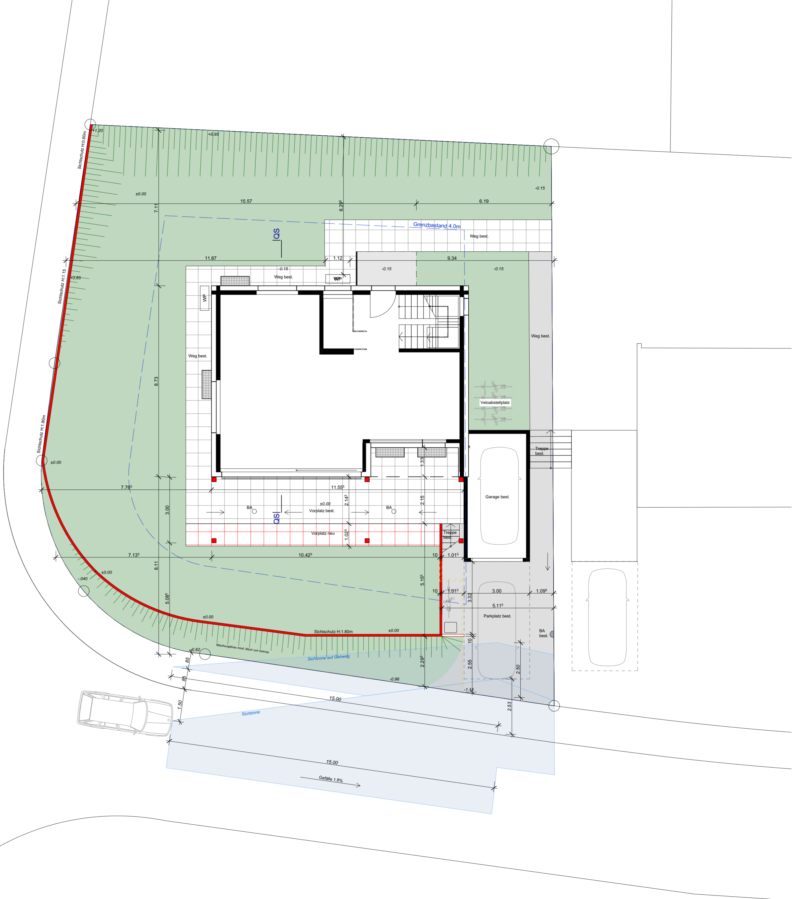
Sichtverhältnisse an Knoten mit Rechtsvortritt